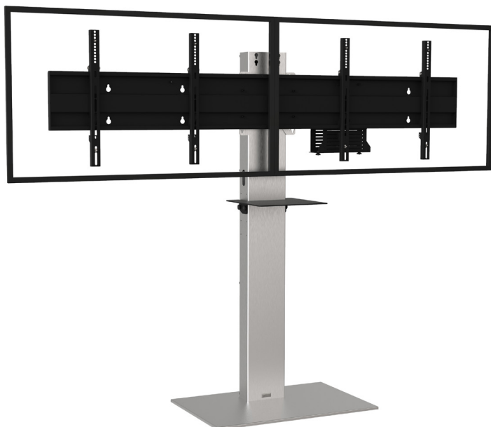
Simulation écrans 46"

Références : XENONSD4050VCPACK XENONSD5255VCPACK