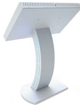
Simulation 42,5" Bildschirm