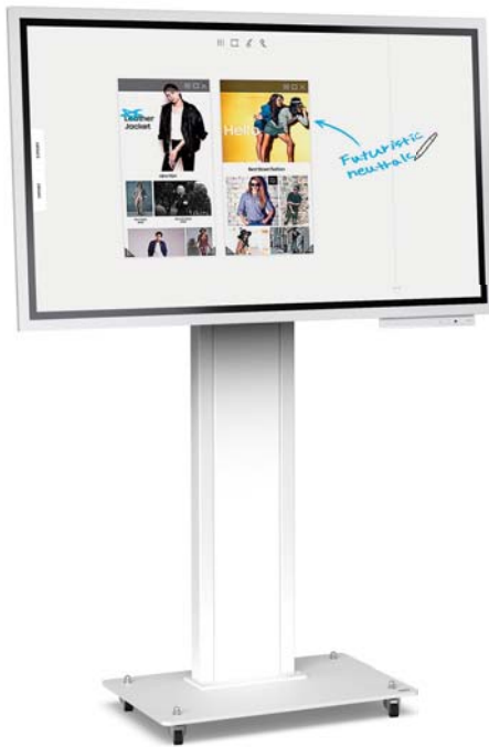
Simulation 55" Bildschirm

Die drehbare Halterung ist für unsere Obox, Boxer, Easyx, Osyx, Xenon-S und Ekinox Möbel geeignet. Sie kann auch an einer Wand befestigt werden. Diese Halterung ist geeignet für die Aufnahme eines 55 bis 65 Zoll Bildschirms, der ins Hoch- bzw. Querformat gedreht werden muss.