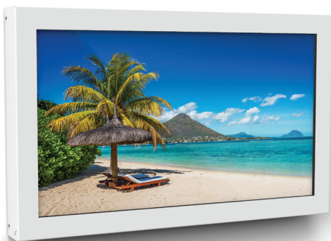
Simulation écran 40"

Références : ENCLOSURE_I_32 ENCLOSURE_I_40 ENCLOSURE_I_42 ENCLOSURE_I_46 ENCLOSURE_I_55 ENCLOSURE_I_65